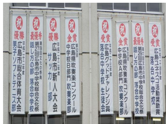
【3年間で多くの賞をいただきました】

3年生にとって初めての入学試験も終わり、今卒業式に向けて取り組んでいます。長いようで短かった3年間。たくさんの思いがあると思います。体育祭ではブロックリーダーとしてブロックをまとめ後輩のよいお手本となってくれました。合唱祭では初めて出身小学校に出向き「出前合唱」として歌った『証』。聴く人に多くの感動を与えてくれました。